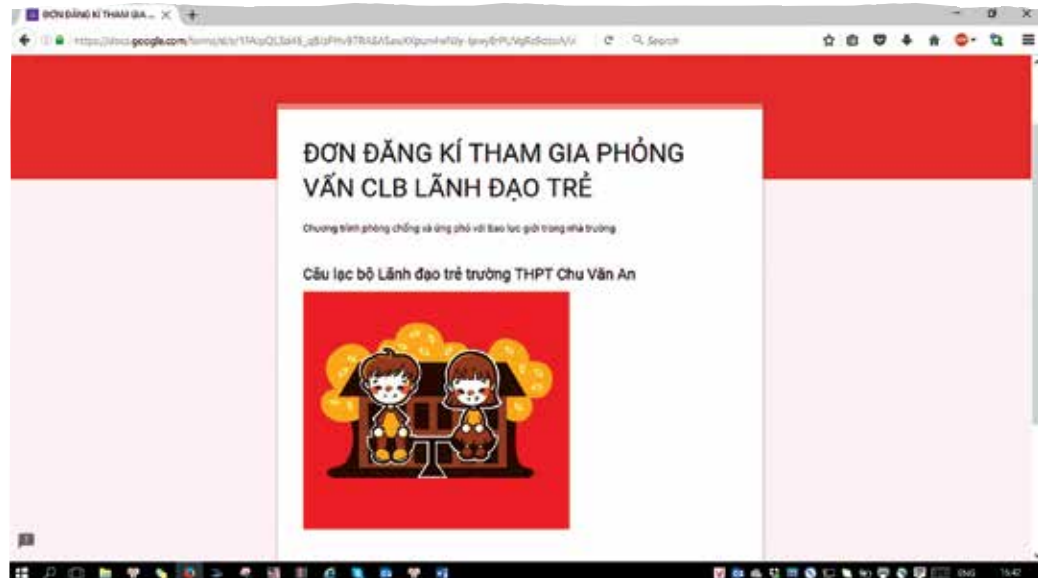
Tham khảo: Đơn đăng ký tham gia phỏng vấn của Lãnh đạo trẻ THPT Chu Văn An https://docs.google.com/forms/d/e/1FAIpQLSd46_qBJzPHv97RA8ASawXXpun4wNJy-lpwyErPUVgRs9dzoA/viewform

Sơ tuyển qua hồ sơ: trong vòng 1 tuần (tính từ thời điểm kết thúc nhận hồ sơ)