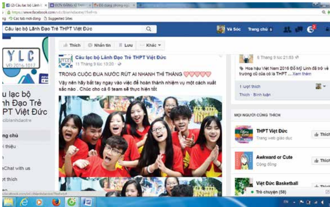
Vòng thi: Làm việc nhóm của Lãnh đạo trẻ THPT Việt Đức, năm học 2015-2016

Mỗi nhóm nhận hàng chục hồ sơ đăng ký tham gia, nhưng “số lượng chỗ trống có hạn” 😊 phần lớn các nhóm chỉ tuyển khoảng 7 đến 10 thành viên mới cho mỗi năm. Chính vì vậy, được trúng tuyển là một niềm vui, là vinh dự cho các bạn được nêu tên trước toàn trường.