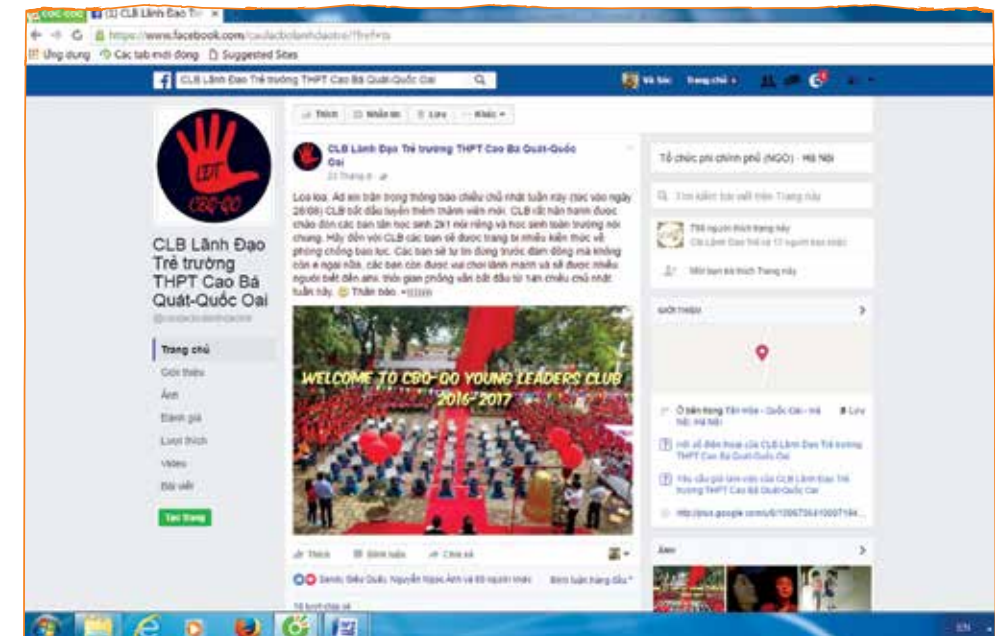
Ảnh chụp màn hình: Đăng tuyển thành viên trên Facebook fanpage của Lãnh đạo trẻ trường THPT Cao Bá Quát huyện Quốc Oai, năm học 2016-2017 https://www.facebook.com/caulacbolanhdotre/?fref=ts

Có thể tạo các sự kiện gây thu hút trên trang fanpage và khuyến khích các bạn học sinh theo dõi và chia sẻ thông tin.