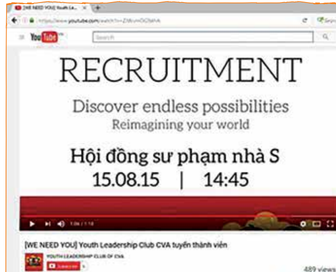
Tham khảo clip quảng bá tuyển chọn thành viên của Lãnh đạo trẻ THPT Chu Văn An năm học 2014-2015 tại đường link https://www.youtube.com/watch?v=ZIWumOG94hA

Với các trường chưa có nhóm Lãnh đạo trẻ, thành viên Ban tuyển chọn có thể gồm thành viên Ban chấp hành chi đội/chi đoàn trường, cố vấn Đoàn trường hoặc tổng phụ trách Đội và ban đại diện cha mẹ học sinh. Trong các năm tiếp theo khi nhà trường đã có nhóm Lãnh đạo trẻ, Ban tuyển chọn sẽ gồm các thành viên chủ chốt trong Ban điều hành nhóm Lãnh đạo trẻ nhiệm kỳ trước và cố vấn đoàn trường.