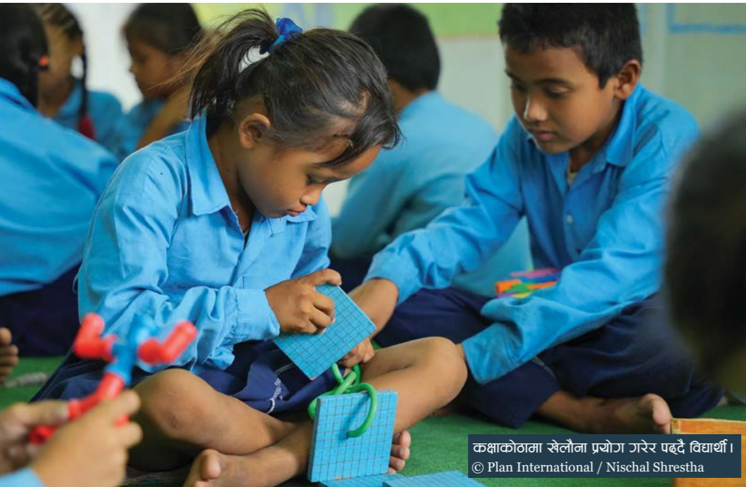
कक्षाकोठामा खेलौना प्रयोग गरेर पढ्ने विद्यार्थी।