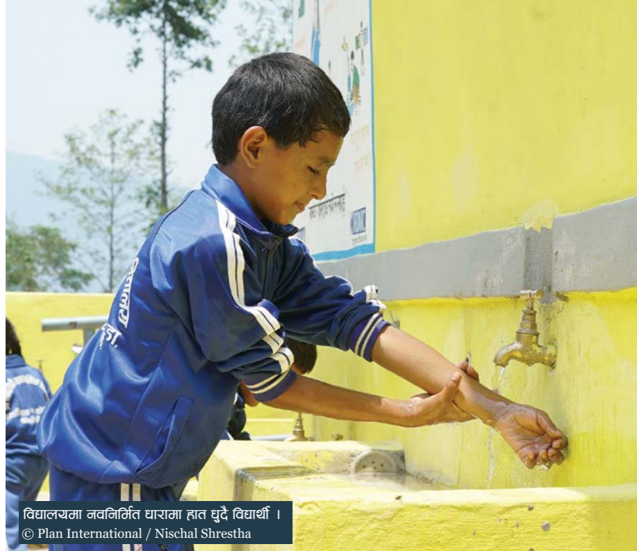
विद्यालयमा नवनिर्मित धारामा हात घुट्टे विद्यार्थी ।