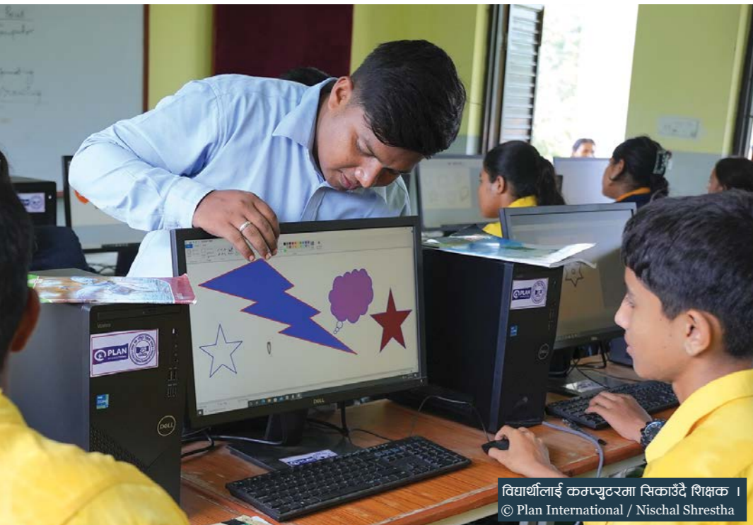
विद्यार्थीलाई कम्प्युटरमा सिकाउँदै शिक्षक ।