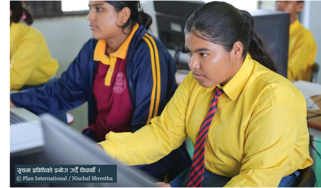
सूचना प्रविधिको प्रयोग गर्दै विद्यार्थी ।

गुणस्तरिय शिक्षालाई वृद्धि गर्न प्लान इन्टरनेशनल नेपालले साभेदार संस्था ह्यान्ड्स नेपालको समन्वयमा यो विद्यालयमा आइसिटी एकिकृत गरी पढाइका लागि सहयोग गरेको छ । त्यसका लागि संस्थाको तर्फबाट विद्यालयलाई १४ थान कम्प्युटरसहितका सामग्री प्रदान गरिएको छ ।