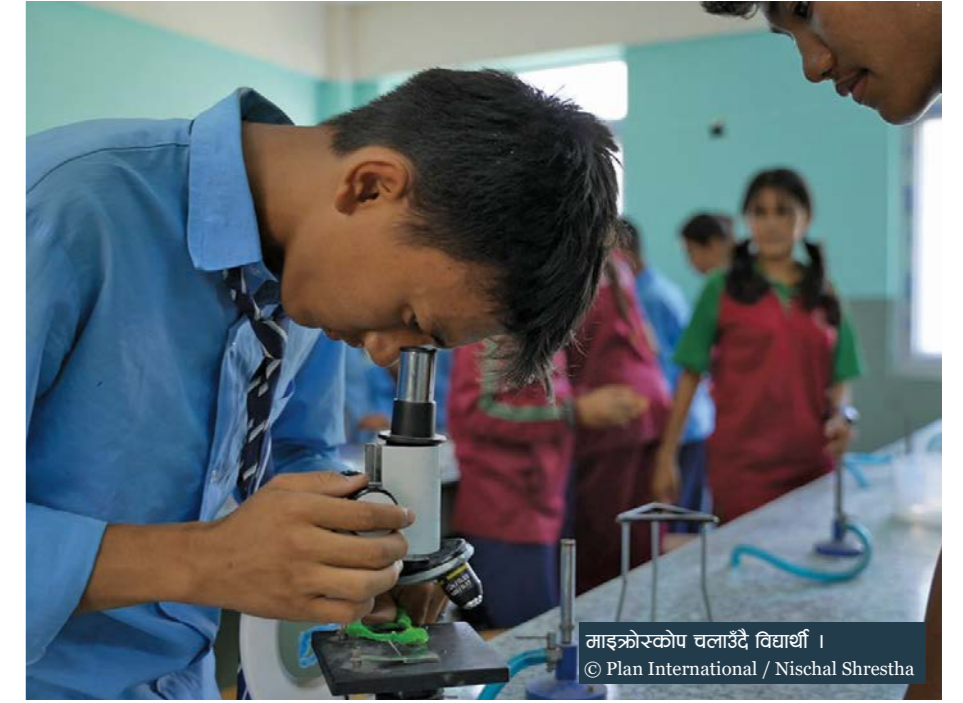
माइक्रोस्कोप चलाउँदै विद्यार्थी ।