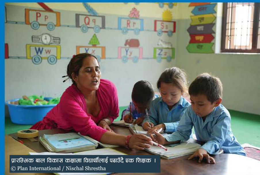
प्रारम्भिक बाल विकास कक्षामा विद्यार्थीलाई पढाउँदै एक शिक्षक ।