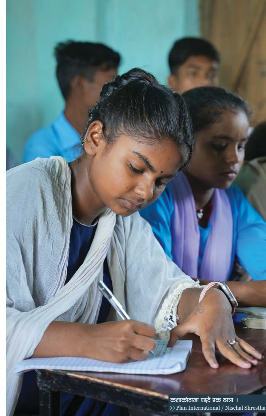
कक्षाकोठामा पढ्दै एक छात्रा ।

विद्यालय जाने उमेरका थुप्रै विद्यार्थी शिक्षावाट वञ्चित भएपछि प्लान इन्टरनेशनल नेपालले स्थानीय तह र विद्यालयसँगको सहकार्यमा उनीहरूलाई कक्षाकोठामा फर्काउने अभियान सञ्चालन गरिएको विद्यालयमध्ये रामप्रसाद मावि पनि एक हो ।