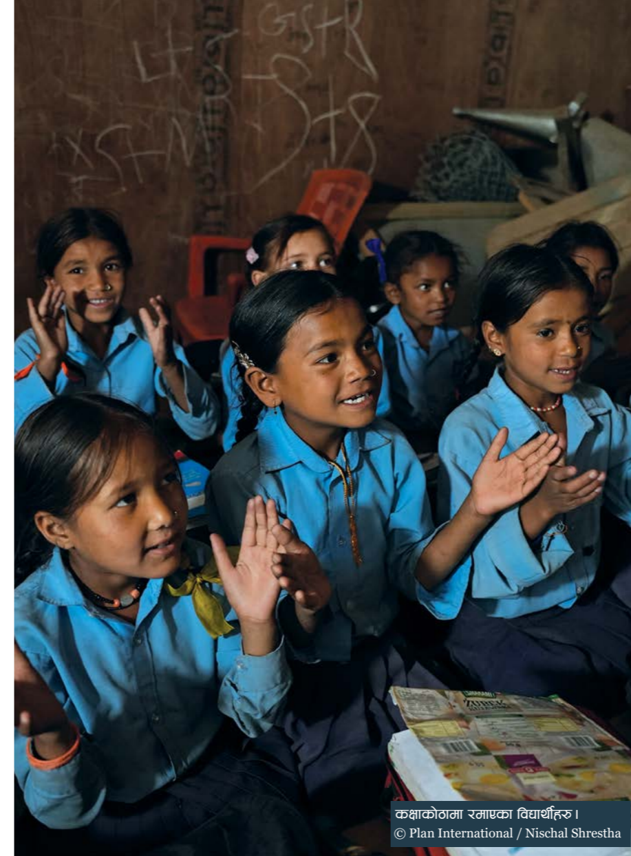
कक्षाकोठामा राम्राका विद्यार्थीहरू।