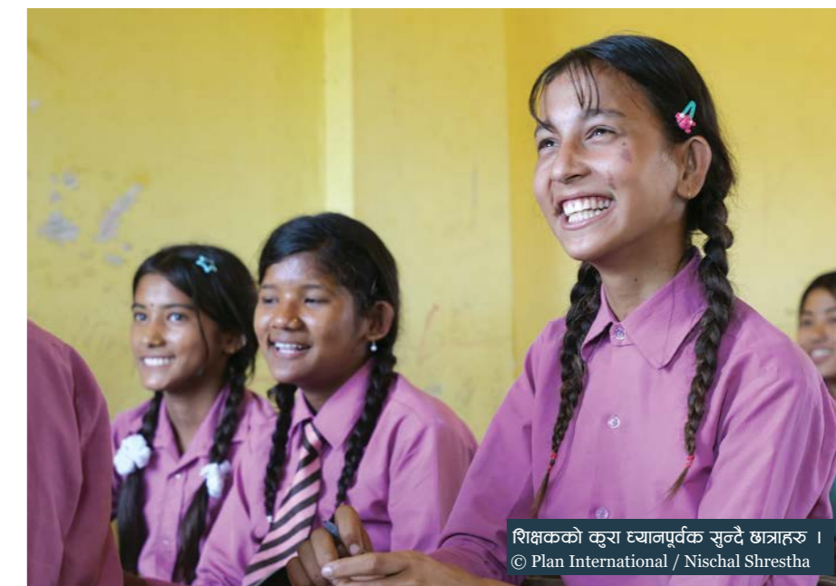
शिक्षकको कुरा ध्यानपूर्वक सुन्दै छात्राहरू ।