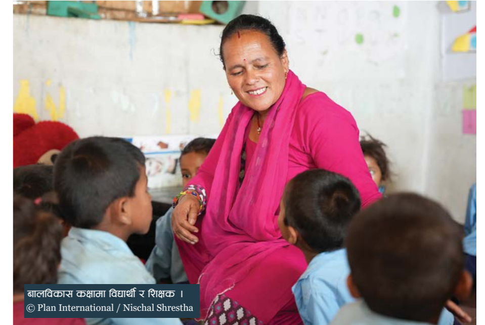
बालबालिकाको सिकाइलाई विद्यार्थी र शिक्षक ।