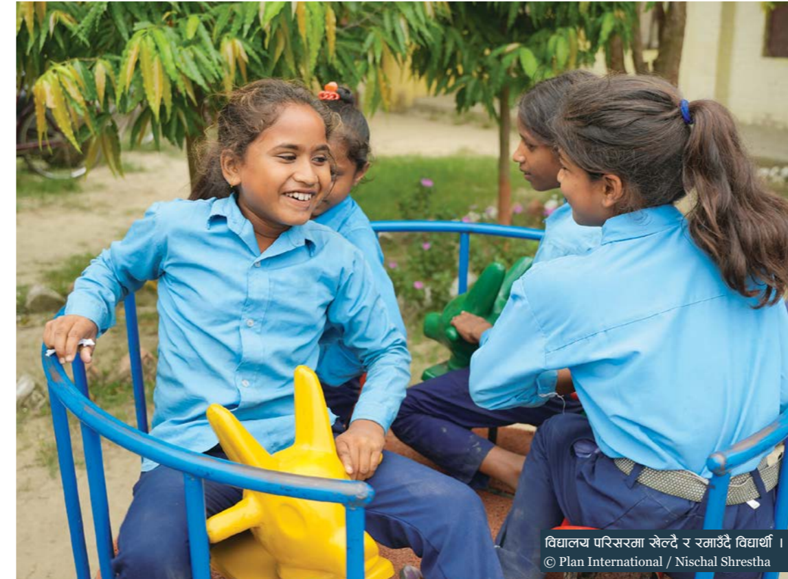
विद्यालय परिसरमा खेलौं र रमाउँदै विद्यार्थी।