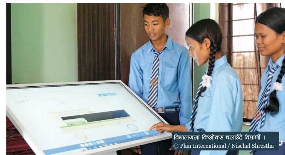
विद्यालयमा किओक्स चलाउँदै विद्यार्थी ।