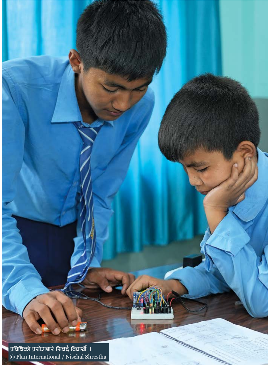
प्रविधिको प्रयोगबारे सिकदै विद्यार्थी ।

मैले तालिममा धेरै विषय सिक्ने मौका पाएँ, ब्लुटूथको प्रयोग गरी कन्ट्रोल कार, लाइट सेन्सर, ग्याँस सेन्सर, साबुन उत्पादन जस्ता विषयबारे हामीलाई सिकाइएको थियो ।