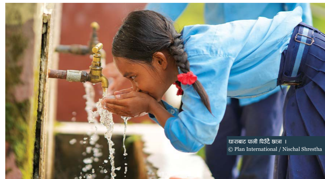
घाराबाट पानी पिउँदै छात्रा ।

नगरपालिकाको सहयोग र शिक्षकहरूको सक्रियताले विद्यालयको शैक्षिक वातावरणमा सुधार आएको उनले बताए । सापकोटाले भने-“एकिकृत शिक्षा सूचना व्यवस्थापन प्रणाली जुन डिजिटल मोडमा छ त्यसमा विद्यार्थीको तथ्यांक अद्यावधिक गर्न थालेपछि विद्यार्थीको विविधिकरणसहितको तथ्यांकको आधारमा आवश्यक योजना बनाइ पठनपाठनलाई अघि बढाउन निकै सहज भएको छ । अबको हाम्रो यात्रा गुणस्तरिय शिक्षा प्रवर्द्धन गर्ने रहेको छ ।”