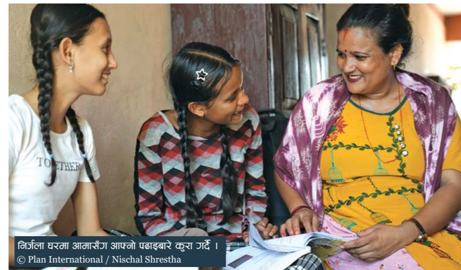
निर्जला घरमा आमासँग आफ्नो पढाइबारे कुरा गर्दै ।

कोरोनाका कारण आफ्नो सन्तानको पढाइ विग्रिएको भन्दै चिन्तित भएका अभिभावक अहिले भने खुशी हुन थालेका छन् । सिकाइ आपूर्णमा विद्यालयले सञ्चालन गरेको “उपचारात्मक कक्षा (remedial class) को प्रभाव आफ्ना बालबालिकामा देखिएको उनीहरूको अनुभव छ ।