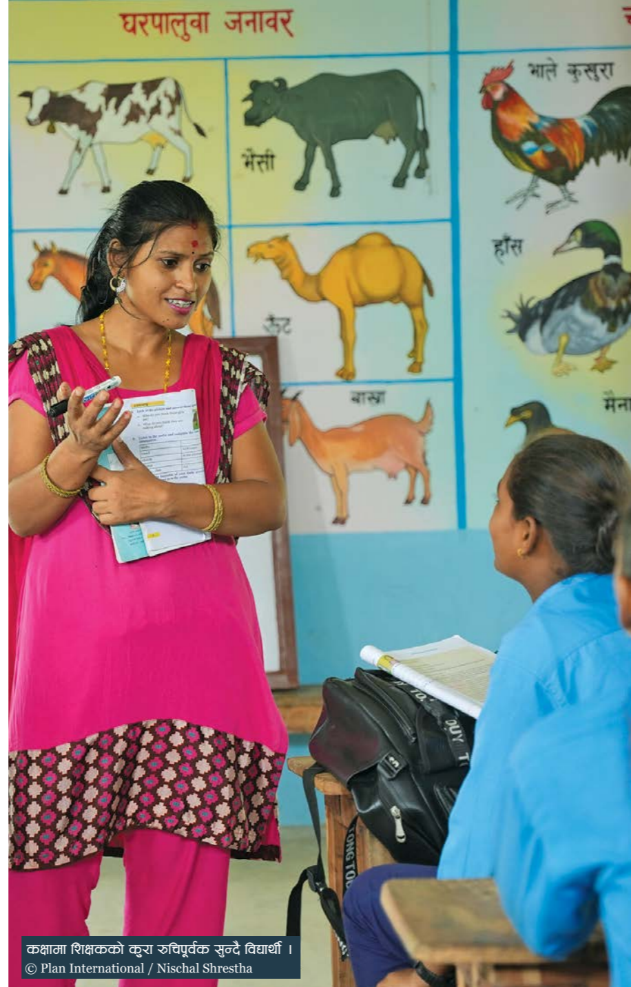
कक्षामा शिक्षकको कुरा रुचिपूर्वक सुन्दै विद्यार्थी।