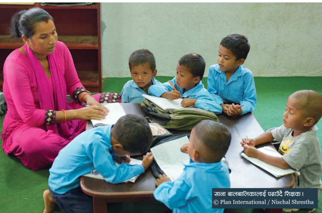
साला बालबालिकालाई पढाउँदै शिक्षक ।

थुप्रै विद्यार्थीहरूको सिकाइ सहजीकरणमा यो पाठ्यक्रम सहयोगी हुने आशा गरेका छौं ।” यो पाठ्यक्रम निर्माणमा पनि प्लान इन्टरनेशनल नेपालले उल्लेखनीय सहयोग रहेको थियो ।