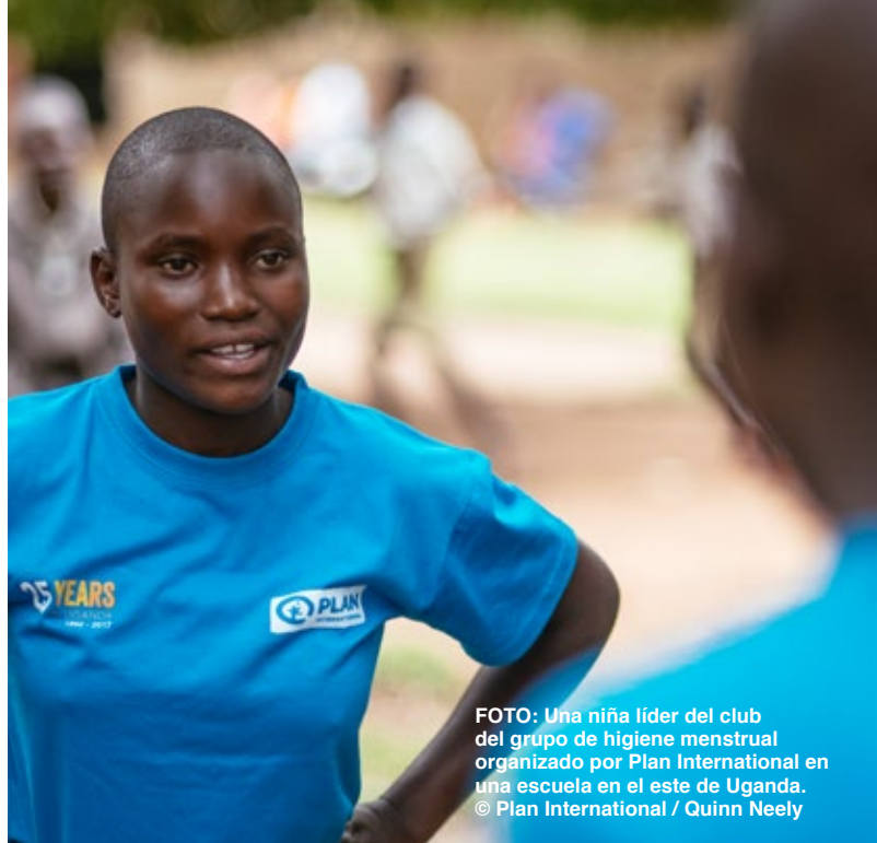
FOTO: Una niña líder del club del grupo de higiene menstrual organizado por Plan Internacional en una escuela en el este de Uganda.

Las niñas en España también identificaron y expresaron resentimiento por los roles familiares tradicionales: