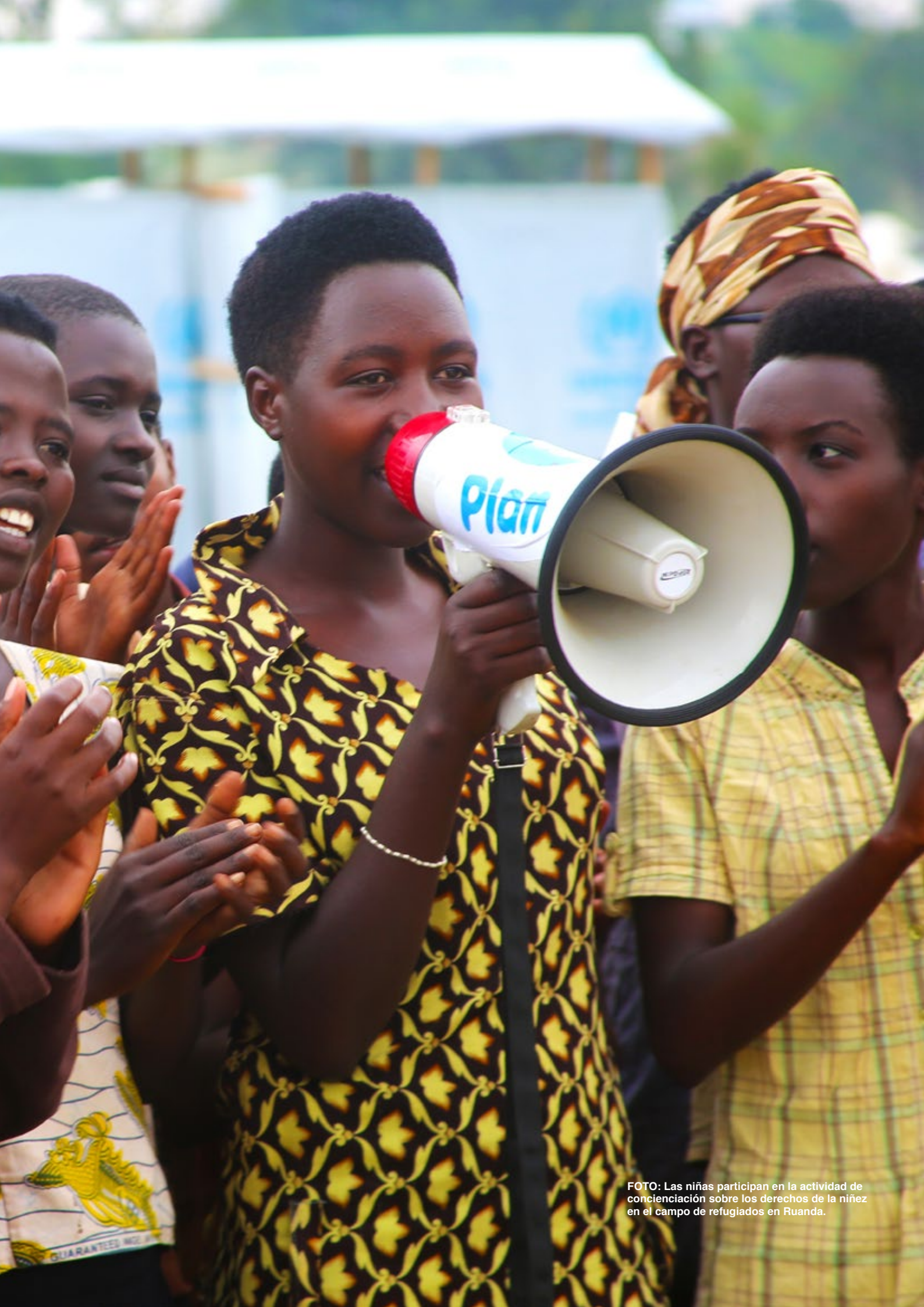
FOTO: Las niñas participan en la actividad de concienciación sobre los derechos de la niñez en el campo de refugiados en Ruanda.