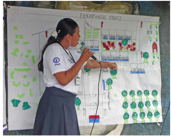
Niña señalando las zonas en peligro de desastres en el mapa de su comunidad en Nicaragua.

Las niñas en los Estados Unidos nos indicaron que aquellos involucrados en la prevención y respuesta ante desastres (como servicios de emergencia) no tienen mucha representación juvenil.