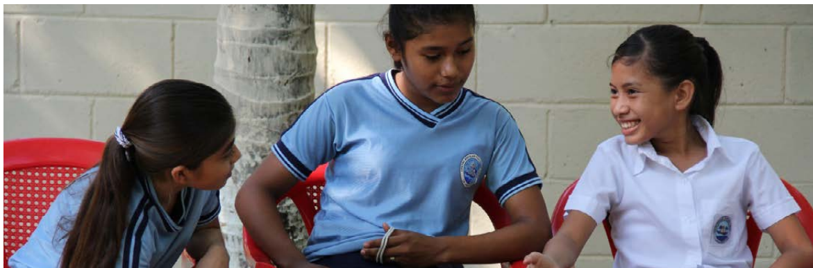
Las niñas de El Salvador hablan en los talleres con jóvenes de Plan sobre las necesidades de las niñas y sus derechos durante desastres.