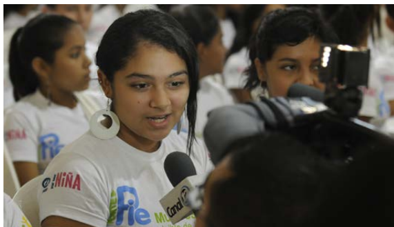
Una niña está siendo entrevistada en un evento el Día Internacional de la Reducción de Riesgo de Desastres.

En muchas situaciones durante el desastre, las voces de las niñas no son escuchadas porque no se les anima a hacerlo, o a veces no se les permite participar en las discusiones incluso en los aspectos que les afectan. Nuestra investigación este año determinó que a menudo la prevención de desastres y los comités de respuesta son liderados por hombres y mujeres, especialmente las niñas, a menudo son excluidas. Si las niñas no están presentes y no pueden expresar sus preocupaciones sobre su seguridad, o necesidades de educación o de salud, entonces ¿cómo podrán responder aquellos en posición de autoridad? Es vital que las necesidades de las niñas sean comunicadas y puestas bajo la atención de aquellos que puedan ayudarles a hacer sus vidas más seguras, saludables y su futuro más brillante.