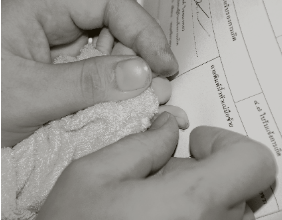
A un bebe le toman sus huellas dactilares durante el proceso de registro de su nacimiento.