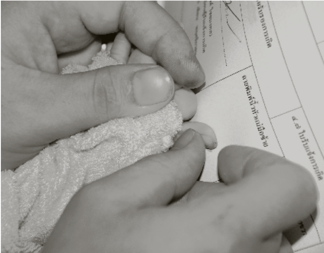
Photo : Les empreintes digitales d'un bébé sont prises dans le cadre du processus d'enregistrement des naissances. Plan / Cesar Bazan