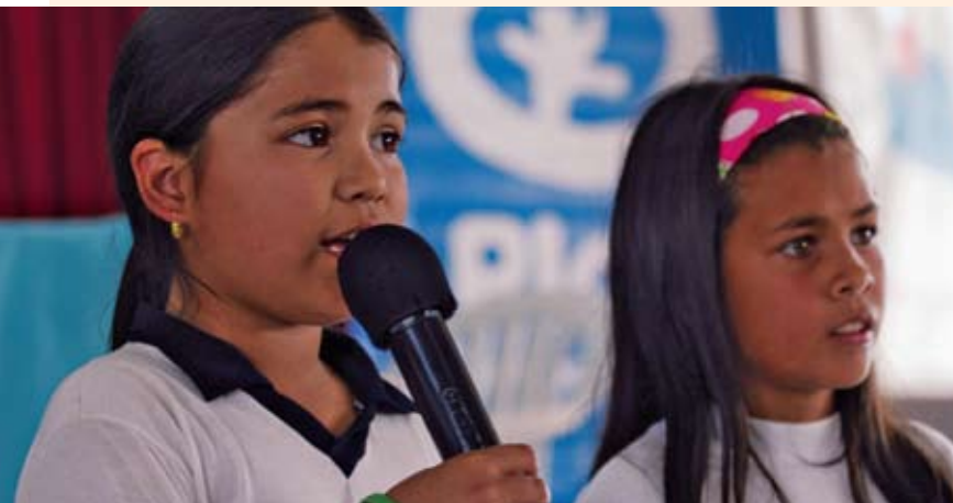
© Plan/ Luis Vera. Defensoras de los derechos del niño y de la niña, Paraguay.