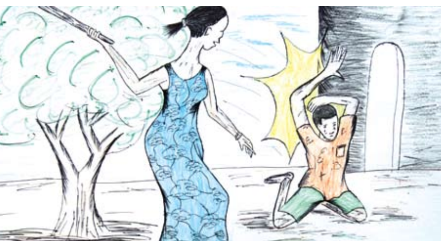
© Alf Berg. Foto a dibujo de un niño.

El castigo corporal no sólo ocurre en los países en vías de desarrollo porque también es legal en Corea, Francia, y varios estados de Australia y los Estados Unidos. Teniendo en cuenta incluso las prisiones, los hospitales psiquiátricos y el ejército, la escuela es la única institución en los Estados Unidos en que el uso de la violencia sigue siendo legal.